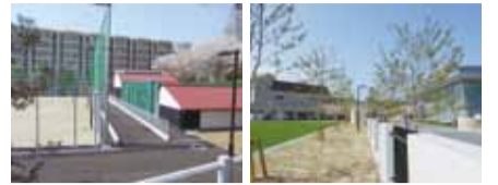
テニスコート、弓道場 グラウンド、正門