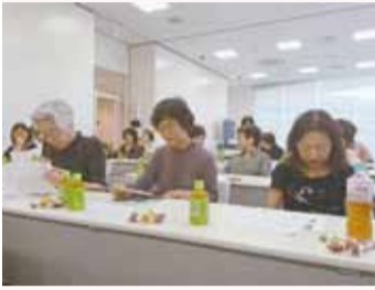
聞きいるクラス委員の方々