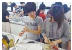
写真左: EAT タイダンス ※ EAT: アジア食文化プログラム 写真上: 韓国語研修 cooking class

*その他: 他大学・他団体主催の研修(ASTW、青年の翼等) ※表中●印欄は基金を活用した派遣者数