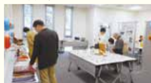
食器、アクセサリ、日用品、折り紙のコマなど。ありがとうございました。

バザーと卒業生の休憩室として利用してもらい、同窓会として参加しました。手探りのスタートでしたが、無事に終了できましたのも、送料も負担して品物を提供していただいた同窓生の皆様や、足をお運び下さいました卒業生・学生・地域の皆様のおかげです。バザーの収益金 44,350円は同窓会活動に使わせていただきます。(事業 測上和子)