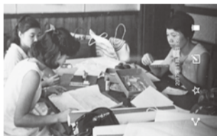
六条院製作中の大16国文学科のみなさん

学生からの声を受けてスタートした生活力アップ講座第2回。今回は季節に合わせた楽しく参加できるように、12月9日(土)10時から、「簡単手作りクリスマスオーナメント」を企画しました。生活に必要なボタン付け、すそまつり、スナップ付けに使う基礎的な縫い方で誰でも簡単に作れる靴下型のツリー飾りです。材料はキットにして用意しました。